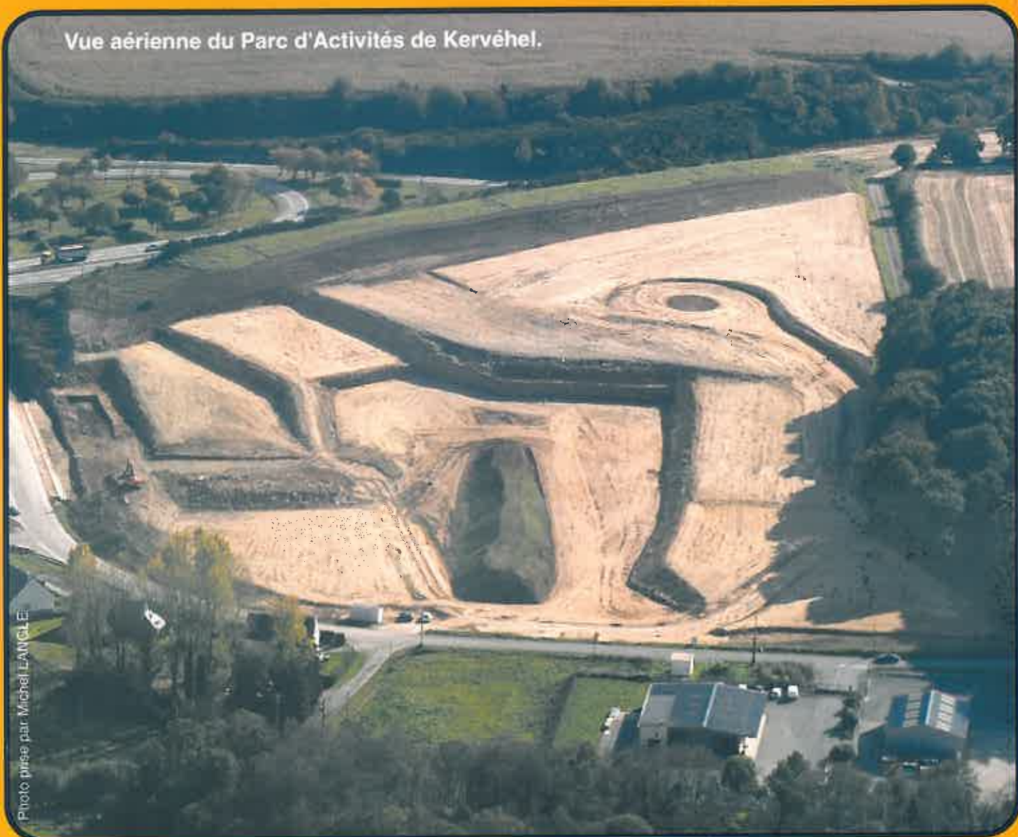
Vue aérienne du Parc d'Activités de Kervéhel.