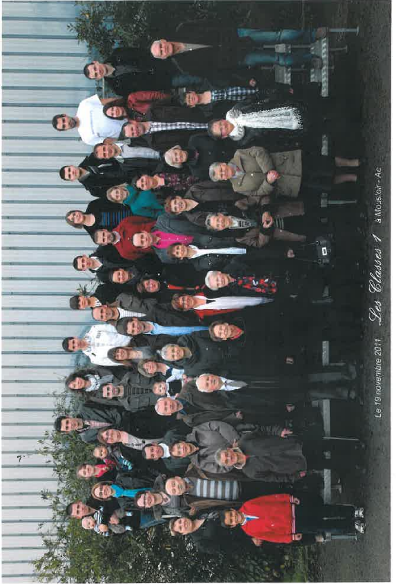
Le 19 novembre 2011 Les Classes 1 à Maustoir - Ac