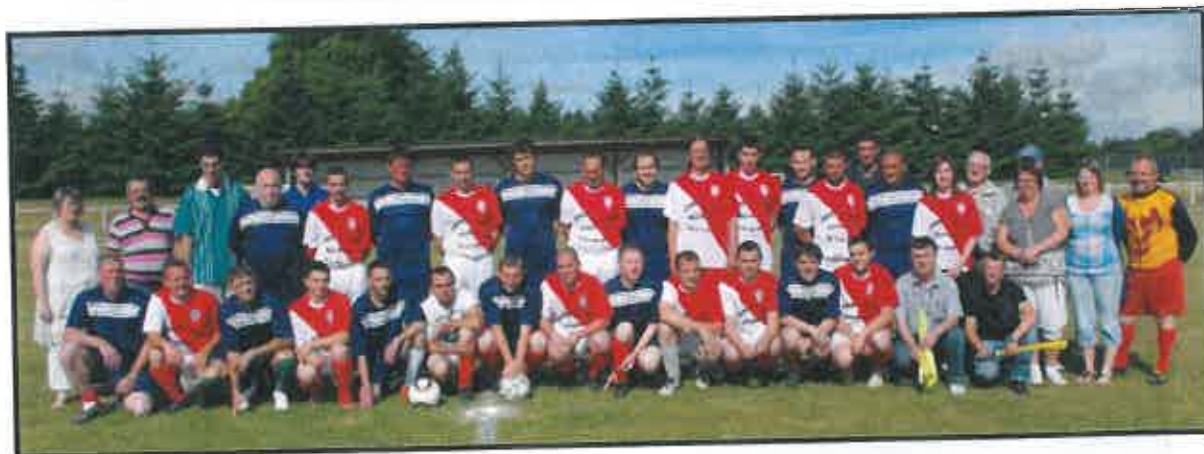
Une partie des équipes du match des retrouvailles du samedi 28 mai 2011

l'adresse suivante : http://www.avs-moustoir-ac.com